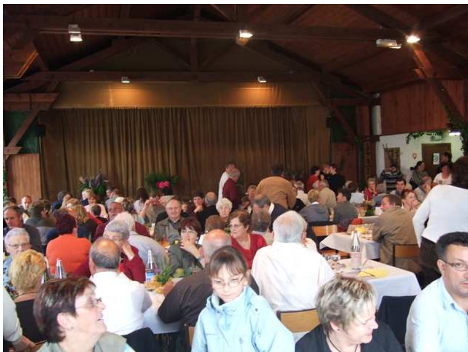
Photo souvenir de la fête de GERBEPAL 15 juin 2008

Pour toutes les personnes qui veulent contacter le C.A.U.E son siège se situe 5 avenue Gambetta à EPINAL , Tél. 03 29 29 89 40 – Fax 03 29 29 89 45 – e-mail caue88@cg88.fr